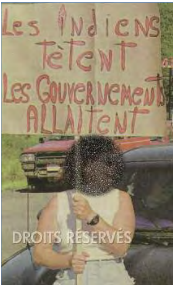
En situation de crise, la frontière entre la manifestation des idées et l'intolérance est facile à franchir. Au cours d'une contre-manifestation, en août 1998, des citoyens des environs de Pointe-à-la-Croix ont bloqué l'accès au Nouveau-Brunswick pour protester contre les barricades dressées quelque temps plus tôt par des Micmacs de Listuguj. Cette photo, qui a fait la une des grands quotidiens, en dit long sur l'état d'esprit des manifestants. L'affiche, on le voit, véhicule un préjugé fort répandu voulant que les autochtones, sans distinction, soient des éternels « exploités du système ».

l'opinion des francophones et des anglophones du Québec pour le compte de La Presse et de Radio-Québec , révélait que 52 % des francophones interrogés se disaient d'avis que la qualité de vie dans les réserves est « bien meilleure » ou « un peu meilleure » que celle des Québécois vivant dans le reste du Québec. Plus étonnant encore, seulement 9 % des francophones répondants étaient d'avis que les conditions de vie étaient beaucoup moins bonnes dans les réserves. Les résultats indiquaient par ailleurs des résultats différents chez les anglophones.