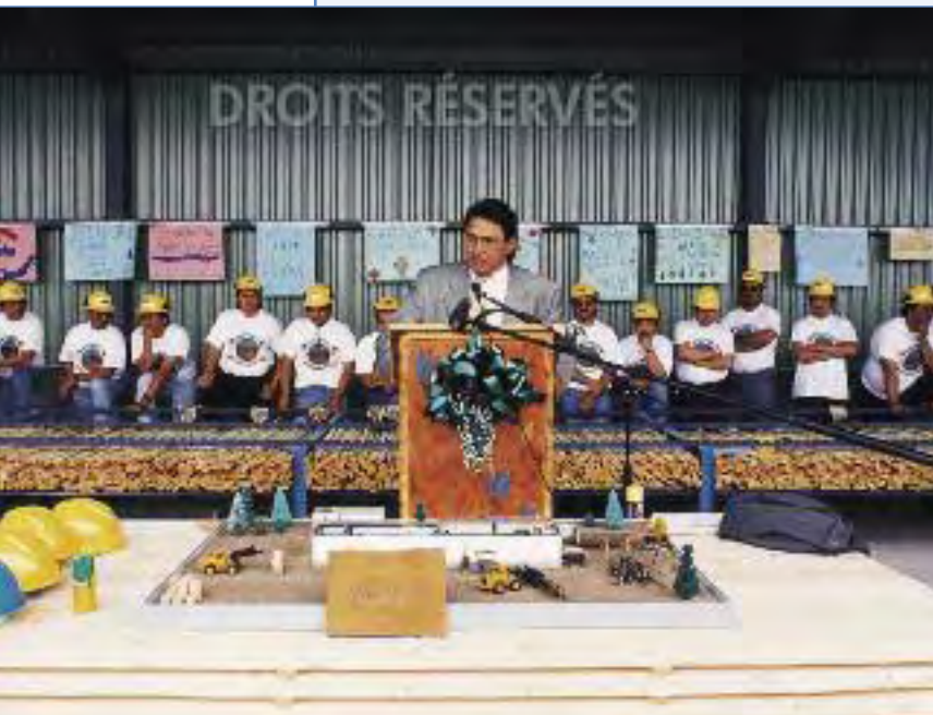
Un groupe de travailleurs cris assiste à l'ouverture de la scierie de Waswanipi, une entreprise résultant du partenariat entre une corporation crie et une papetière. Les activités ont débuté en 1997.

En 1992, on s'inquiète à Chibougamau des répercussions économiques de la fermeture de la mine Westminer. Depuis le début des années 80, la population de la ville est en déclin constant. De 12 000 habitants elle est