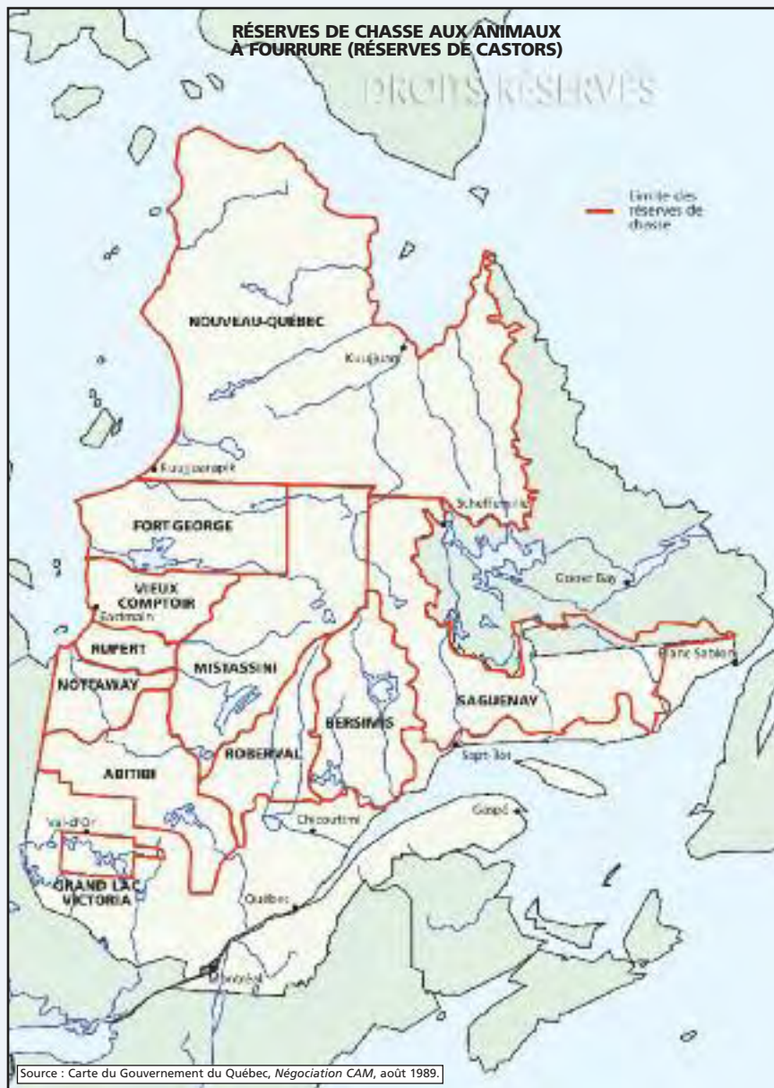
Source : Carte du Gouvernement du Québec, Négociation CAM, août 1989.

Les autochtones ont toujours conservé des droits importants en matière de chasse, de pêche et de piégeage, des droits distincts de ceux des autres québécois. Dans certains cas ces droits sont prioritaires, voire même exclusifs. Des groupes d'intérêt ont souvent cherché à présenter cette situation comme une forme de « passe-droits », une « discrimination » qui s'exercerait au détriment du « citoyen ordinaire ». Nous avons pourtant vu au chapitre 4 qu'il n'y a pas d'incompatibilité entre l'existence de droits distincts et l'affirmation du droit à l'égalité tel qu'inscrit dans nos chartes des droits et libertés. Des situations particulières peuvent en effet exiger que certains groupes aient des droits distincts parce que c'est une façon de leur assurer l'égalité. C'est ainsi que, depuis 1982, la