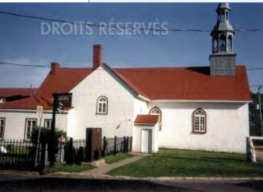
Petite chapelle de Wendake

C'est que Chibougamau est entourée de trois communautés amérindiennes : Mistassini, qui compte, en 1992, environ 2 300 habitants, Waswanipi, avec un peu plus de 700 personnes et le nouveau village Oujé-Bougoumou, alors en construction, qui doit abriter plusieurs centaines de personnes. Voilà une population dont le pouvoir d'achat, par les temps qui courent, est très important ( ibid. ). De nombreux commerçants l'ont compris. Certains d'entre eux se sont même inscrits à des cours de langue crie, conscients de l'importance de satisfaire cette clientèle particulière.