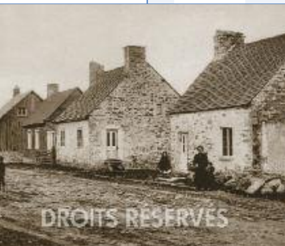
Une rue de Kahnawake (autrefois appelé Caughnawaga) au début du siècle.

« Au temps des régimes français et anglais du Canada, des Amérindiens du Québec forgent une singulière alliance politique connue par la tradition écrite euro-américaine comme étant les Sept Nations du Canada. Cette alliance regroupait les Amérindiens catholiques des villages de la vallée du Saint-Laurent :