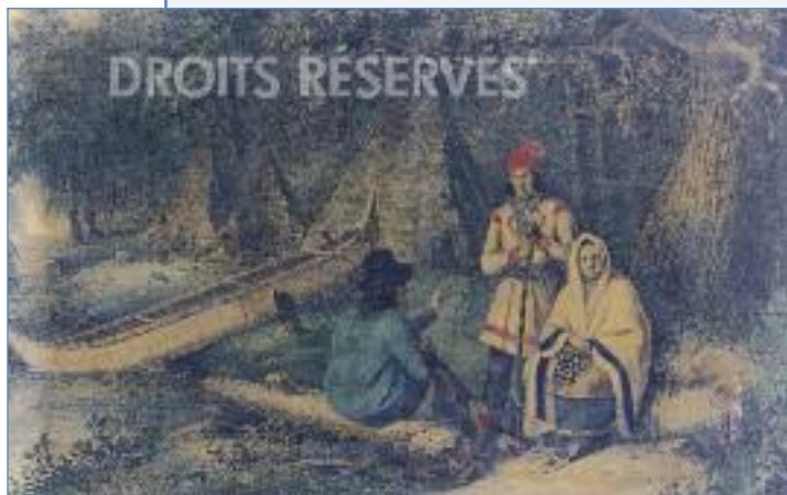
Amérindiens du Bas-Canada.

currence le grand conseil de Kahnawake, et que celle-ci partageait diverses compétences avec les différentes nations membres. Les fédérés s'assuraient, en principe, à la fois d'une cohésion et d'une autonomie gouvernementale et cela, sans remettre en question l'identité des communautés alliées. Ainsi, lorsque ces Amérindiens se réfèrent à la Fédération, ils font appel à l'unité et à une représentation commune. L'organisation politique des Amérindiens du Québec se structure au XVII e siècle, vers 1660. L'alliance sera rompue au XIX e siècle, vers 1860. » (Sawaya, 1998 : 14)