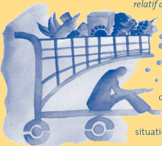
Illustration : Marie-Denise Douyon

L'objectif de solidarité est aussi mis à mal par l'évolution démographique du Québec. Si l'inversion de la pyramide des âges est un phénomène progressif, le départ simultané à la retraite de nombres importants de travailleurs donne